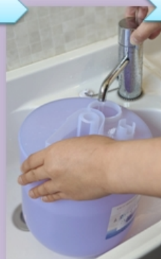
・水道水を満タンまで入れる