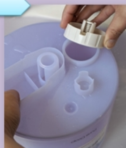
・キャップを閉める 斜めキャップ(以下参照)に 注意して適度に閉めます