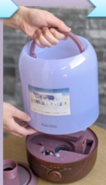
・タンクを取り外す