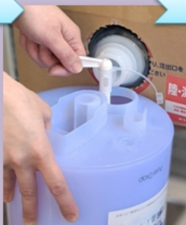
・受け口から洩れないように、 以下を参考に原液を一定量注入