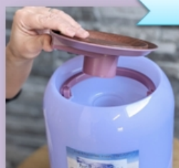
・フタを取り外す